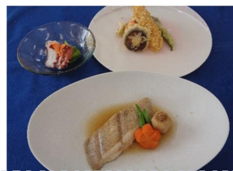
蛸ときゅうりの酢の物 天ぷら たらの煮付け 付け合わせ 含め煮