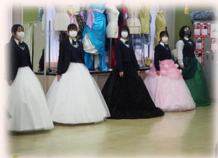
ファッションコース ウォーキング講習会