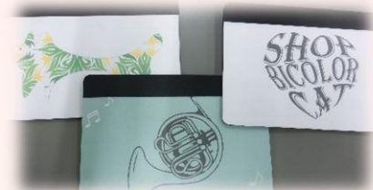
生活教養コース 個人作品製作