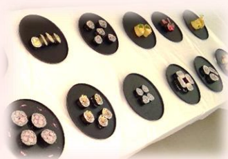
フードコース 個人作品試作