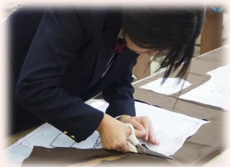
被服検定3級 ハーフパンツ

秘書検定3級の受検が終了し、現在、被服製作技術検定3級、食物調理技術検定3級の検定に向けて準備中です。