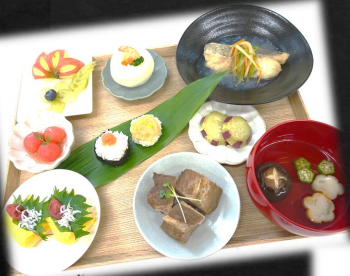
個人作品 『ランチプレート』

今まで学んできた技術や知識を生かし、オリジナルの献立を考え、 何度も試作り、完成させました。