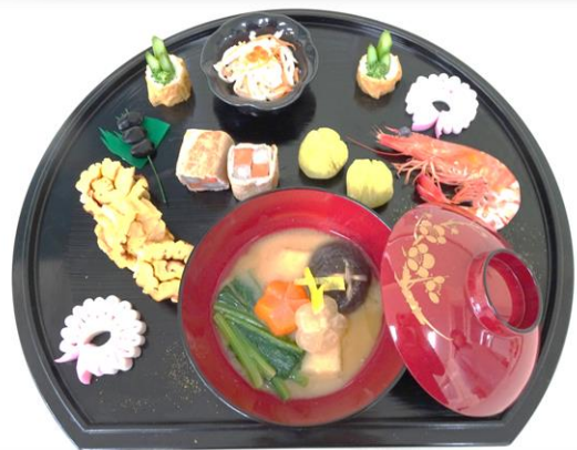
グループ作品 『行事のおもてなし料理』